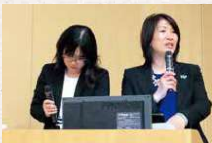
講演は同時通訳で行われました

参加者の感想には、「差別と戦うという姿勢に、強い気持ち、信念を持つことが支援者には必要だと深く感じました」「病院内だけではなく、地域との連携も重要な仕事であると念頭において、地域の他職種と連携を取ってきたい」「国や文化が違って地域支援は大切なことだと知ることができた」「アセスメントの重要性、支援には希望を持ち続けることが大切だと実感した」「ナラティブモデル(その人が語る疾患)の重要性を学びました」「対象者自身の選択に沿って支援していくことをしっかり忘れずにいたいと思いました」など熱意を感じられました。